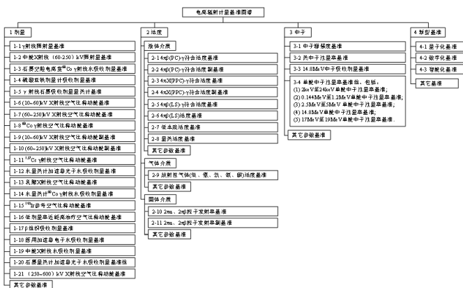
图 1 电离辐射专业计量基准图谱框架