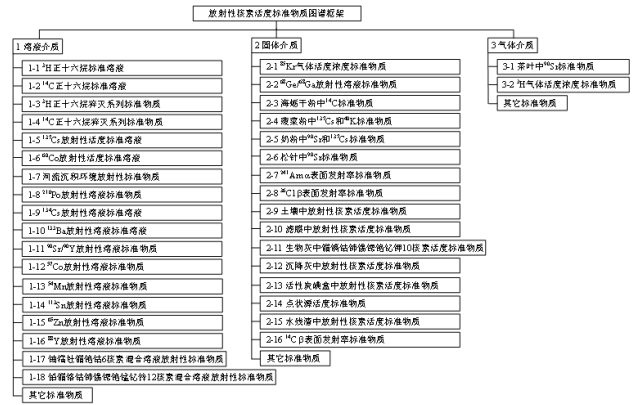
图 3 放射性核素活度标准物质图谱框架